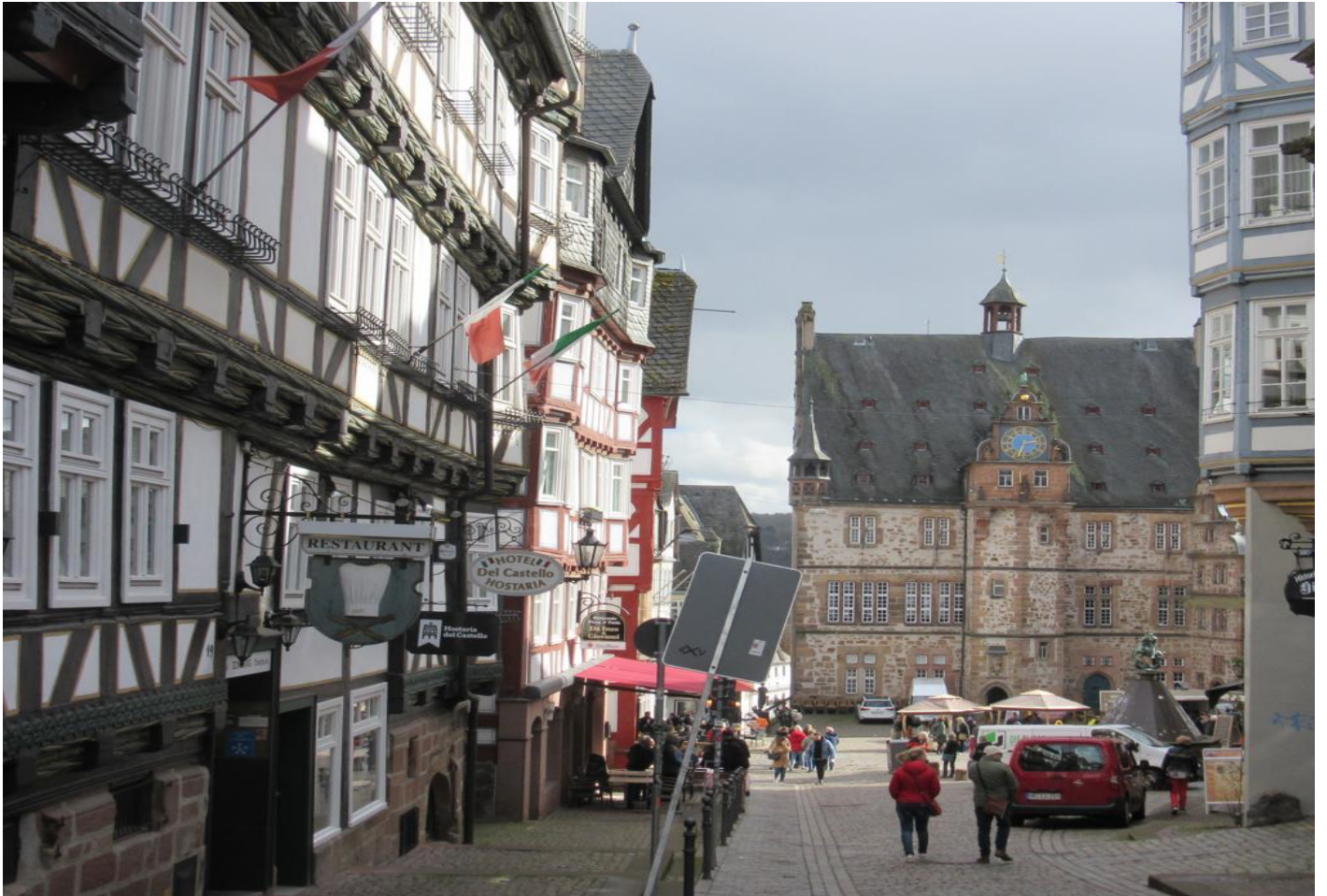
Vue sur l'hôtel de ville