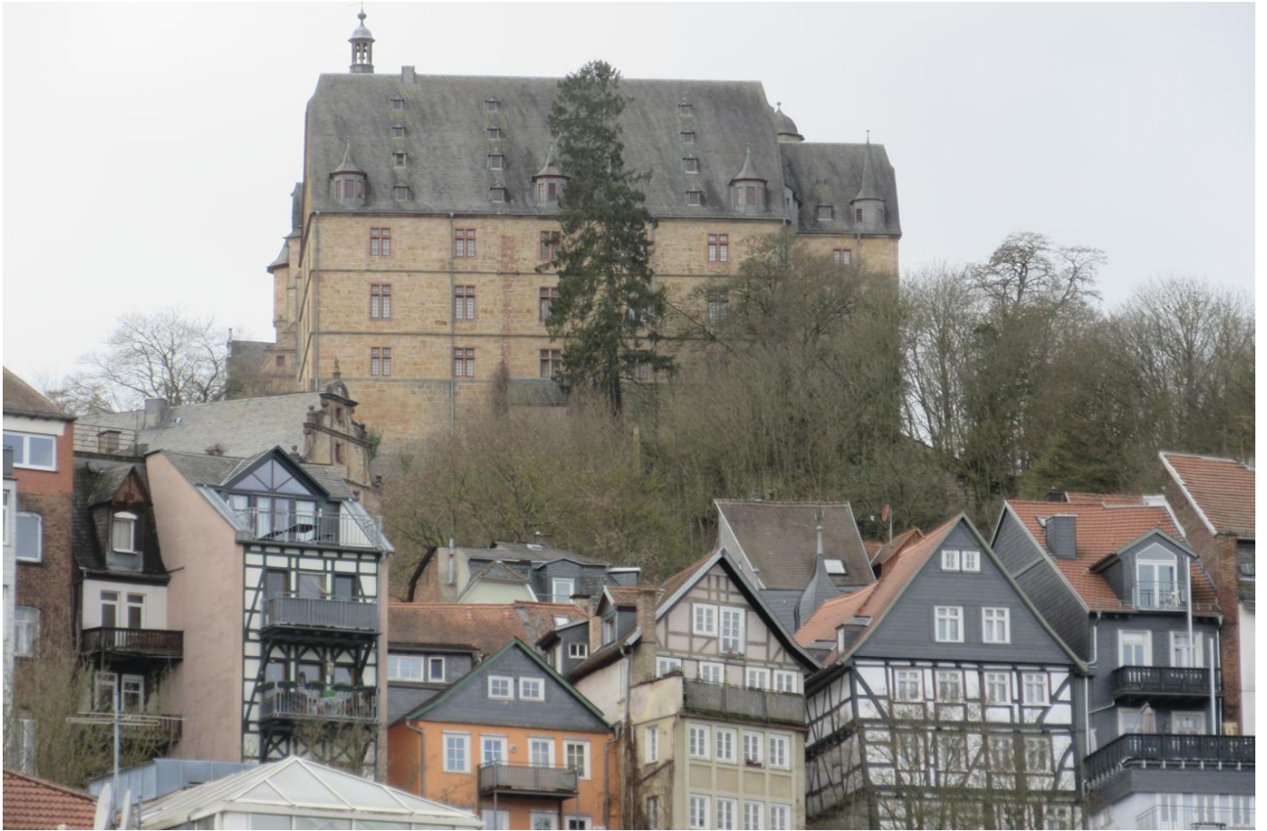
Blick auf das Schloss